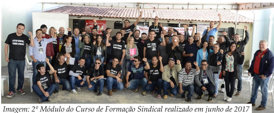
Imagem: 2º Módulo do Curso de Formação Sindical realizado em junho de 2017

Os novos delegados sindicais recebem a capacitação e orientações durante o Curso de Formação Sindical, que o Sindicato promove anualmente. Além disso, são realizadas reuniões periodicamente para fortalecer o próprio sindicato e ampliar a participação dos trabalhadores nas lutas da categoria. O curso de Formação Sindical e a Posse estão previstos para ocorrerem no dia 17 de março, das 8h às 18h , contudo, qualquer alteração na data e horário serão avisados previamente no Site e na página do Sindicato no Facebook. Ao fazer sua inscrição, certifique-se de que poderá comparecer ao Curso de Formação Sindical. Anote na agenda!