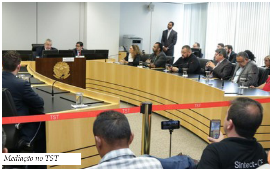
Mediação no TST

No dia 22 de agosto, os representantes dos trabalhadores no Comando Nacional de Negociação compareceram no TST para participar da mediação pré-processual relativo ao Processo Nº TST-PM-PP-5701-24.2017.5.00.0000, sobre o Plano de Saúde. Contudo, a reunião tomou outro rumo, mostrando claramente que não foi à toa e nem aleatória a escolha da data para a mediação sobre o plano de saúde no mesmo dia que estava prevista o início das negociações coletivas da campanha salarial. O Ministro Emmanoel Pereira propôs que a ECT prorrogasse o ACT vigente até o dia 31 de dezembro de 2017 e que houvesse “boa vontade” com o diálogo por parte dos trabalhadores, inclusive não fazendo greve. O Tribunal sinalizou, inclusive, que não haverá garantias de reajustes retroativos ou que a categoria fique isenta de