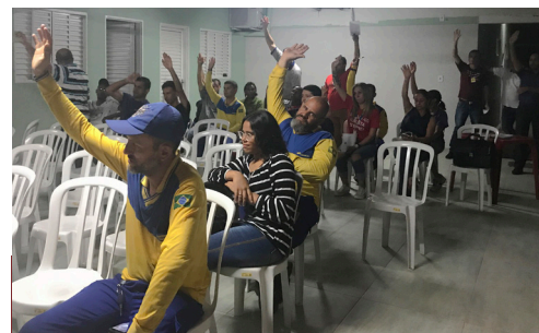
Foto: Assembleia Geral Ordinária realizada no dia 11/11/2019