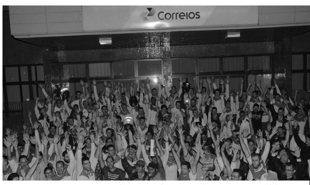
Ectistas aprovam o indicativo de greve durante assembleias

M omentos decisivos para os trabalhadores, dentro e fora dos Correios. Por todo o país, a CUT e as demais Centrais Sindicais articulam a construção de uma greve geral contra a retirada de direitos sociais, trabalhistas e previdenciários, proposta pelo Governo Temer. No âmbito dos Correios, as negociações desta Campanha Salarial estão chegando em sua reta final, sem a certeza de fechamento de um novo acordo.